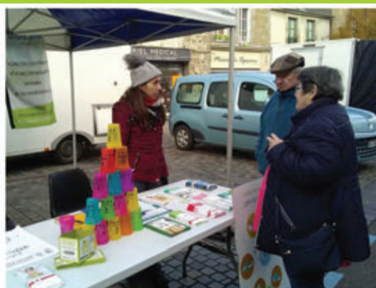
Le service prévention du SMICTOM VALCOBREIZH animera la matinée.

Mardi 6 octobre (16h30-19h30). Entrée libre et gratuite. Contact : SMICTOM VALCOBREIZH Courriel : prevention@valcobreizh.fr ou tél. 02 99 68 17 47