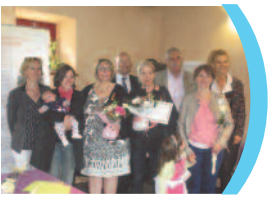
> P3 Médaille de la famille