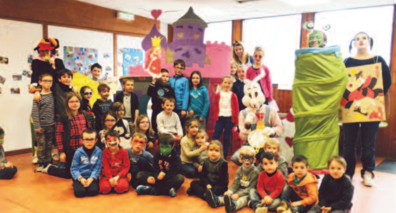
Grand jeu Alice au pays des merveilles