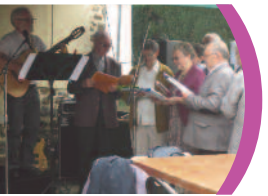
> P7 Une année riche en événements