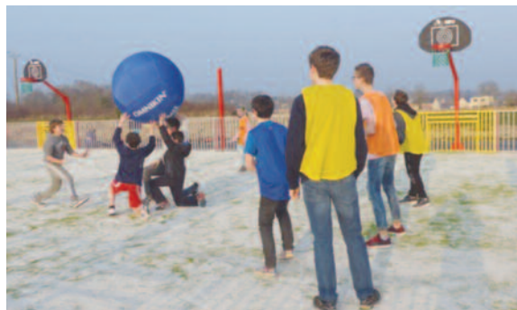
Animation kin ball à Vignoc le 18 mars .

Le GPAS organise un baby foot géant au City stade le 12 juillet. Rendez-vous à 15h. Gratuit et ouvert à tous.