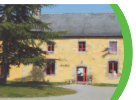
> P 9-11 Conseils municipaux