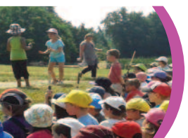
> P8 Cet été, grande rencontre des centres de loisirs